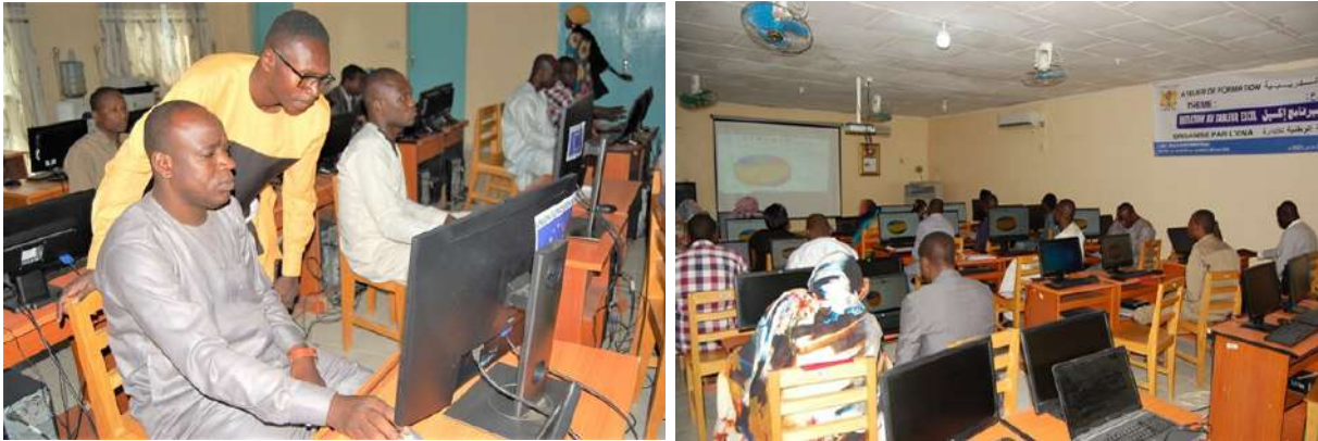
Formation en Tableur Excel

La seconde série de formations était relative au Tableur Excel. La première session de cette série de formations, qui s'est tenue du vendredi 07 au mardi 11 mai, était une initiation au Tableur Excel. Le niveau II du Tableur Excel a fait l'objet de la seconde session qui s'est tenue du lundi 25 au vendredi 29 mai 2021.