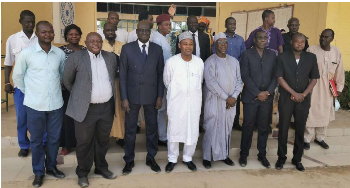
Formation légistique et rédaction administrative

Une série de formations en Rédaction Administrative et en Légistique a été organisée à l'attention des agents publics de l'État. La première session de la formation s'est tenue du lundi 08 au vendredi 12 février 2021 et était prioritairement réservée au personnel de l'ENA. La deuxième session était organisée du lundi 08 au vendredi 12 mars 2021 au profit des agents du SGG et d'autres départements ministériels.