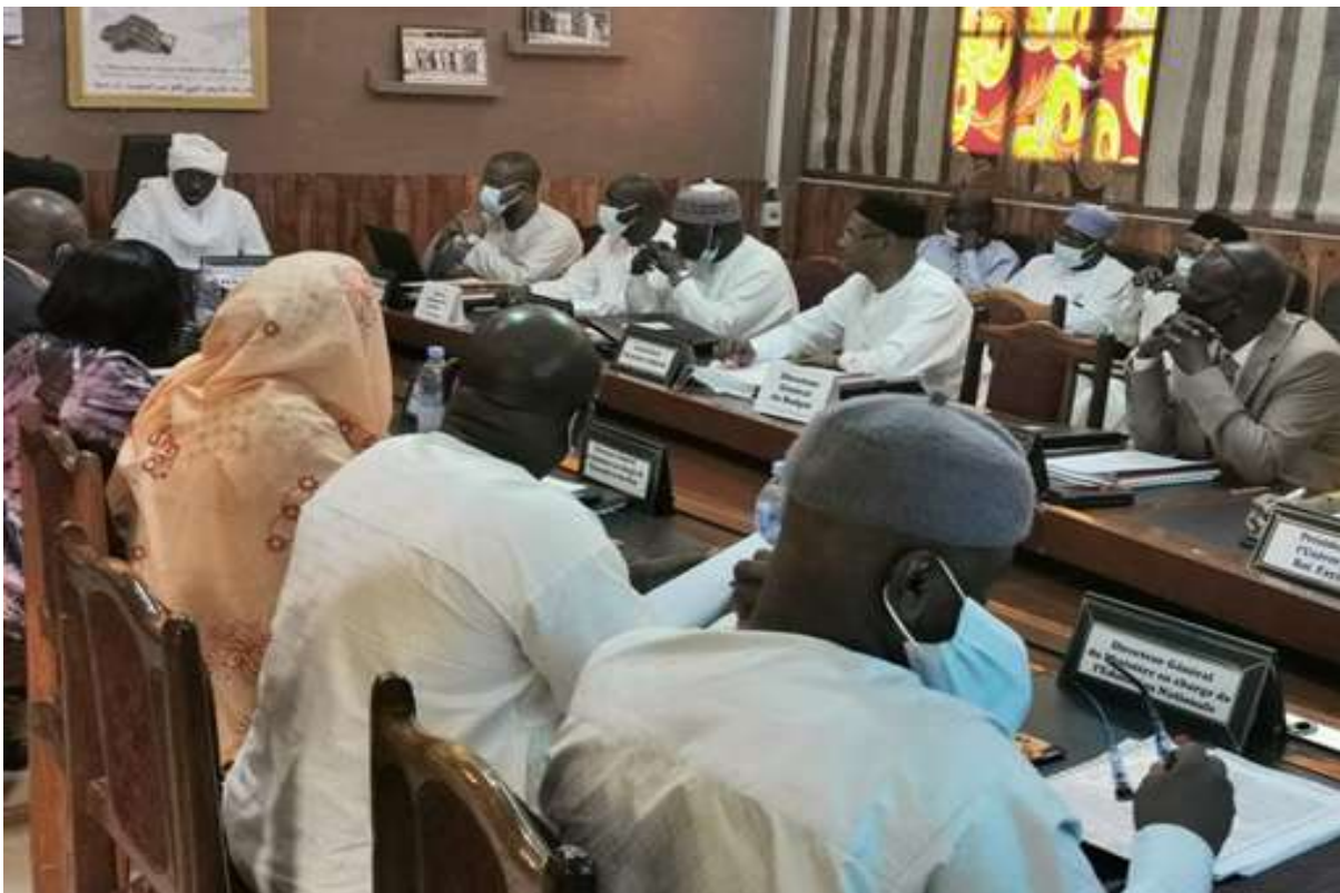
Conseil d'administration du 07 mai 2021 à l'ENA