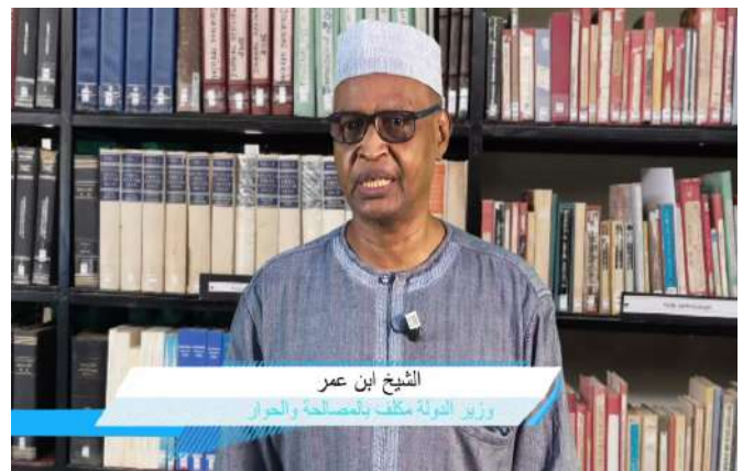
الشيخ ابن عمر وزير التوثيق والتراث

Le générique de début a également été modifié compte tenu des évènements qu'a connus le pays. Pour rappel, chaque capsule consiste à répondre à une question, à décrypter un mot, un concept, un sujet qui fait l'actualité ou encore à réaliser un zoom sur un point d'actualité.