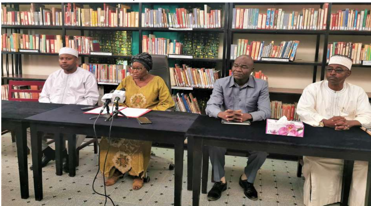
Point presse des membres du jury des concours d'entrée à l'ENA 2021