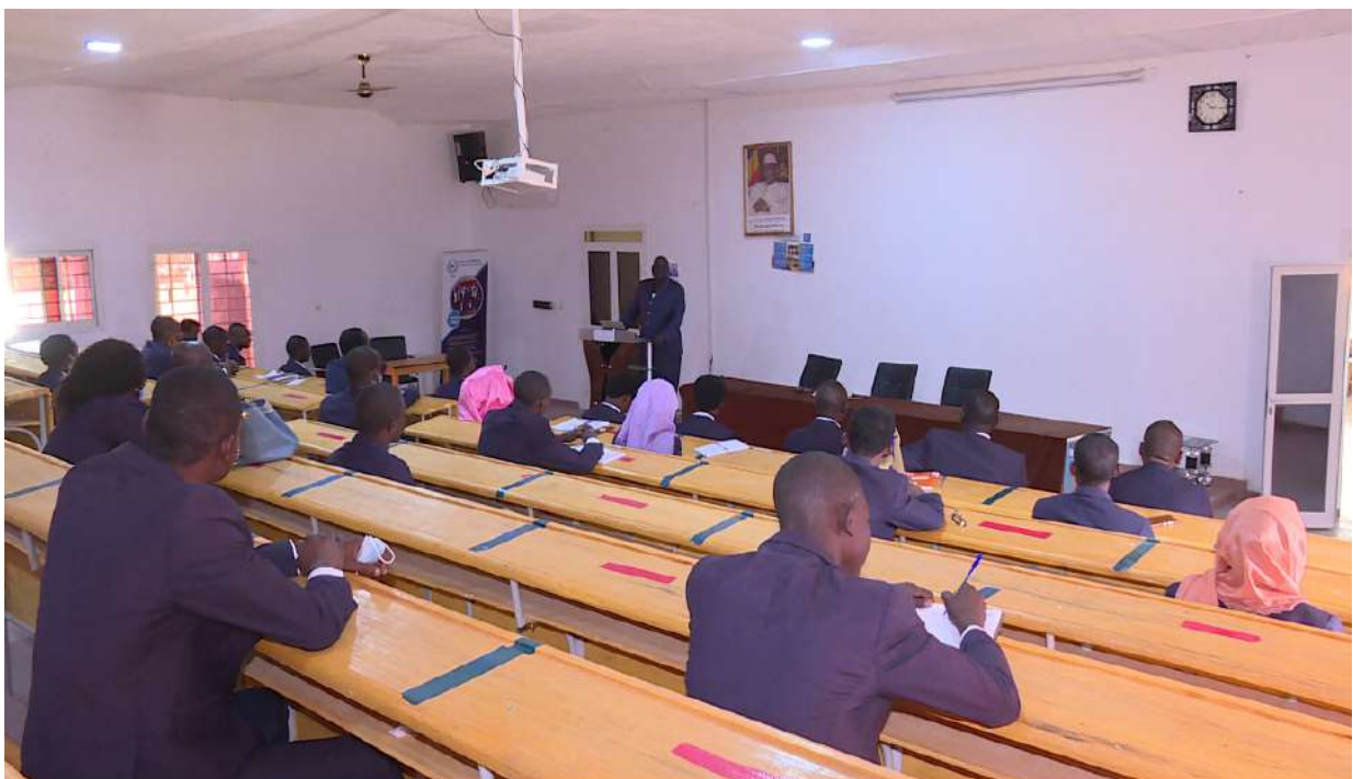
Les élèves en salles de cours