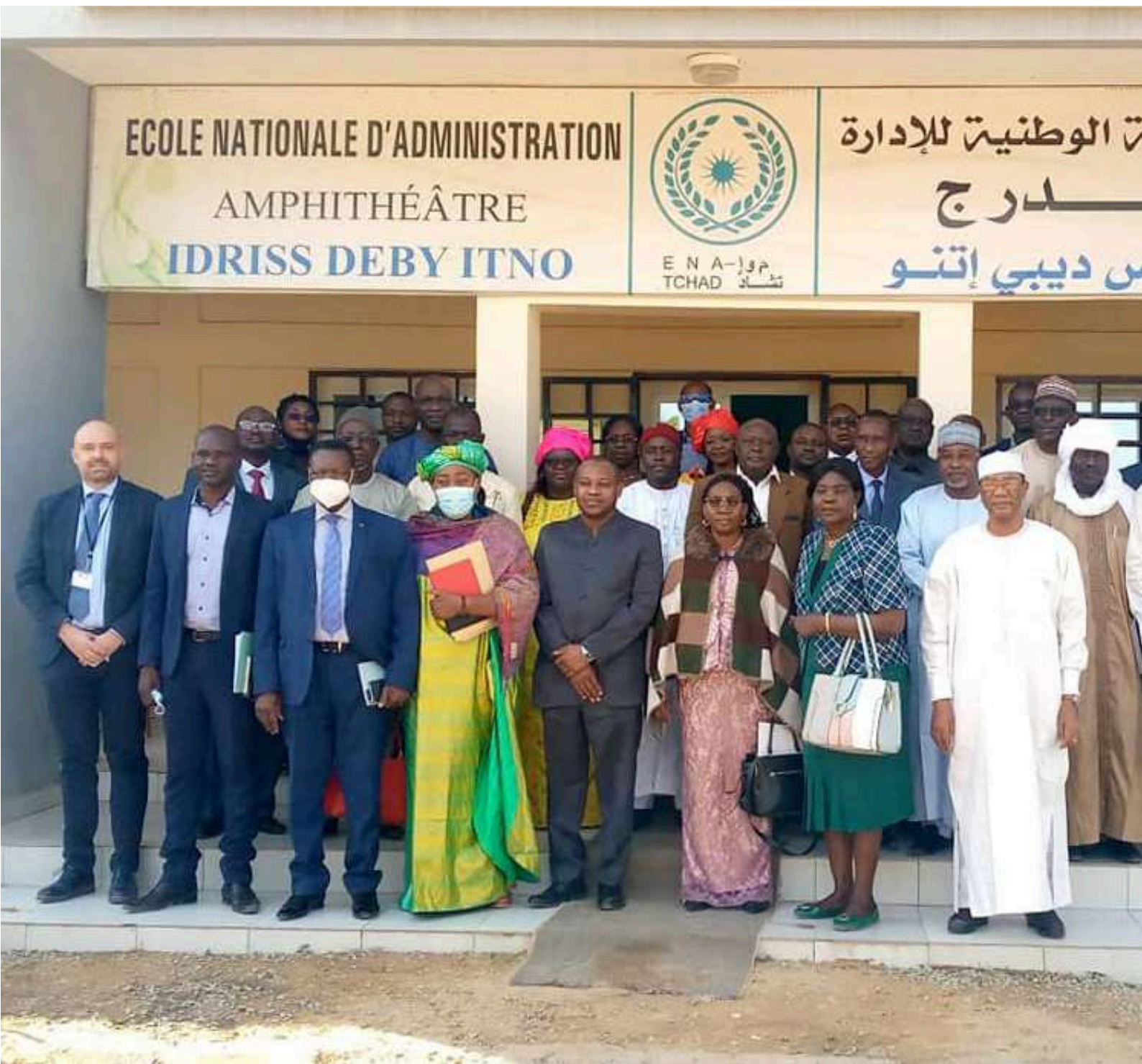
Cérémonie de lancement des travaux d'élaboration des guides