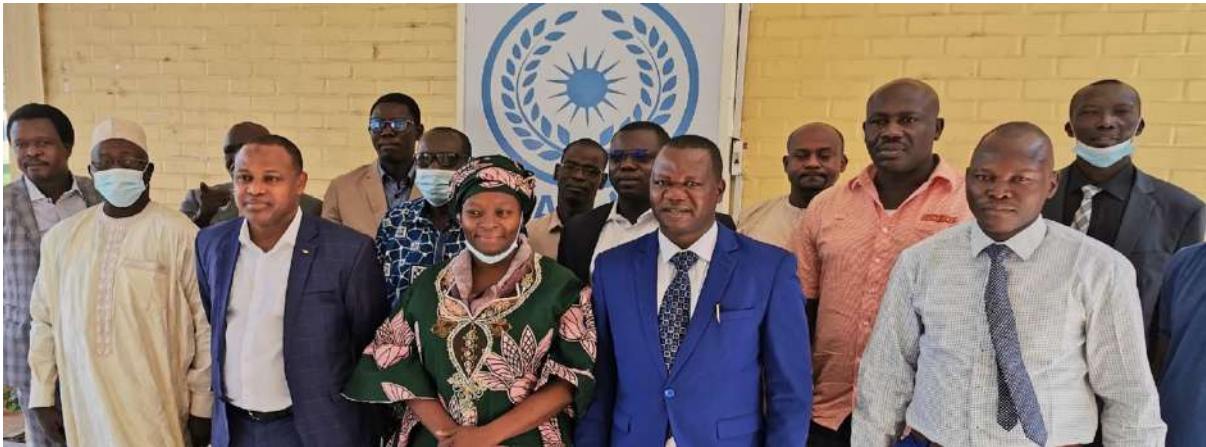
Photo de famille du 1 er CSO du Projet d'Appui à la mise en place et au développement de l'Observatoire.

Dans le cadre du projet d'« Appui à la mise en place et au développement de l'Observatoire de la Violence, de la Prévention de la Criminalité et de la Déontologie Policière-OVPCDP », l'École Nationale d'Administration en consortium avec le Centre d'Études et de Recherches sur la Gouvernance, les Industries Extractives et le Développement Durable (CERGIED) et le Centre de Recherches en Anthropologie et Sciences Humaines (CRASH) a signé le contrat de subvention avec l'Ordonnateur National du FED afin de rendre opérationnel l'Observatoire durant les quinze (15) mois d'exécution du projet.