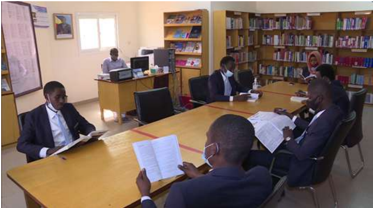
Salle de lecture de la bibliothèque Idriss Deby Itho.

A l'ENA, les activités de l'année 2021 ont été, d'une part, perturbées par la pandémie de la Covid-19, à l'instar d'autres services, et, d'autre part, dominées par les travaux d'organisation des concours.