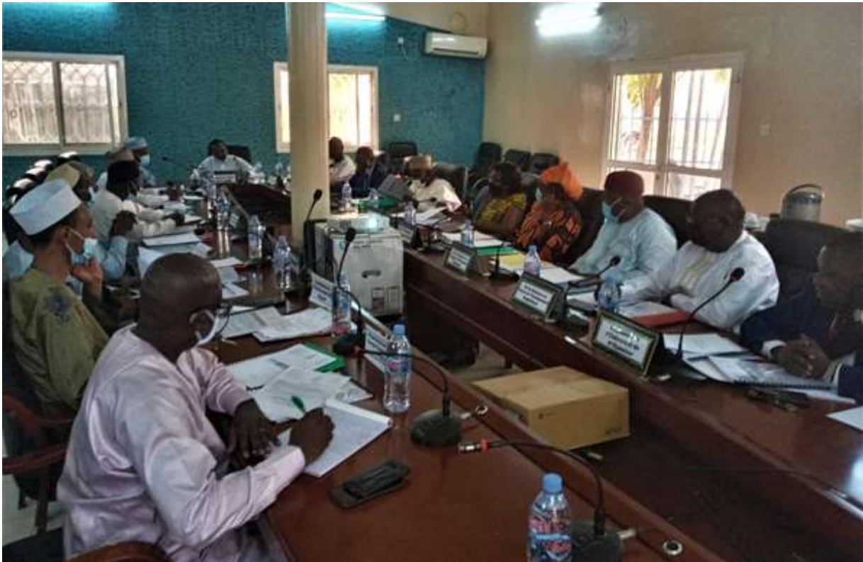
Conseil d'administration du 10 décembre 2021 au SGG

de la Promotion du Bilinguisme dans l'Administration et des Relations avec le Conseil National de Transition, Président du Conseil.