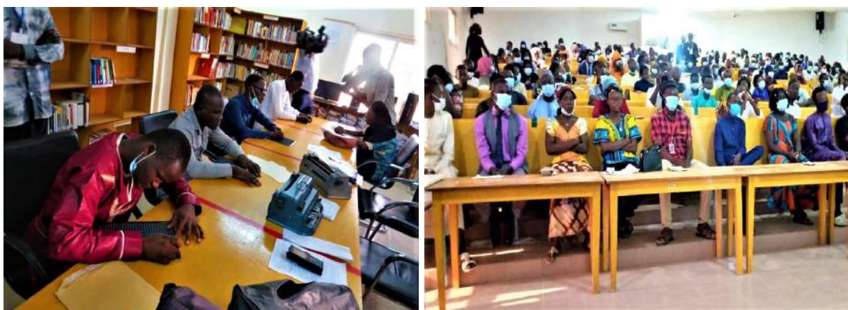
Les candidats en salle de composition

Pour ces concours, la Direction Générale de l'ENA a, par diverses lettres du 09 février 2021, sollicité des audiences auprès de différentes autorités en vue de recenser les profils des cadres dont leurs services respectifs en ont besoin. Sur la base de ces besoins, une fiche portant le N°0104/PR/ENA/PCA/DG/2021 du 09 avril 2021 a été adressée au Maréchal du Tchad, Président de la République, Chef de l'Etat, en vue de solliciter l'autorisation du lancement des concours. C'est ainsi que, par lettre N° 0628/PR/SGP/CATCA/021 du 19 avril 2021, le Ministre d'Etat, Ministre Secrétaire Général de la Présidence de la République a communiqué à l'administration de l'ENA l'accord marqué par le Chef de l'Etat à cet effet. Lequel accord a été entériné par les membres du Conseil d'Administration de l'ENA en leur séance du vendredi 07 mai 2021.