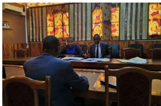
Soutenances des rapports de stages des élèves