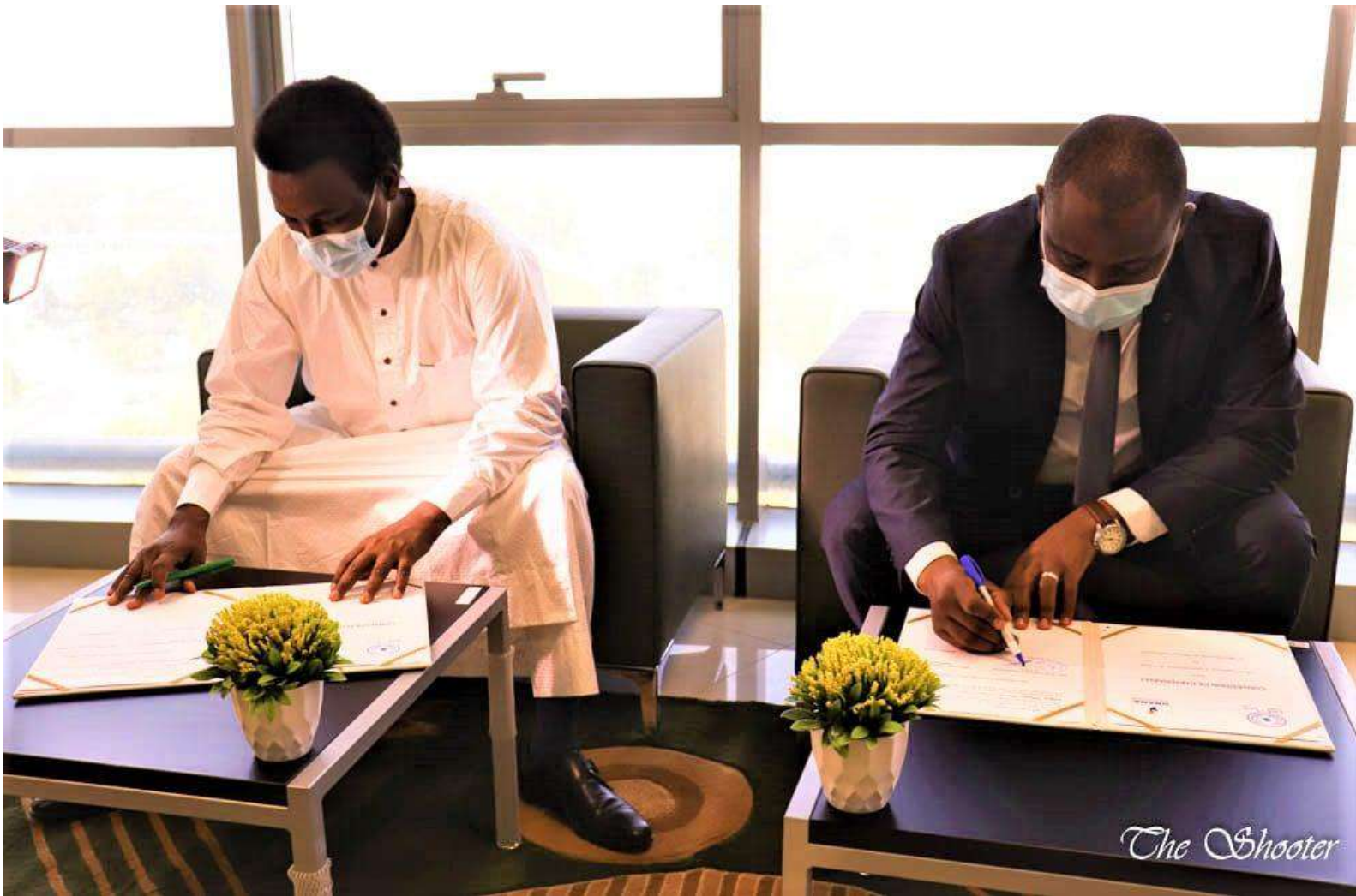
Signature de la Convention entre l' ENA & l' ONAMA